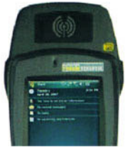
装有RFID模块的 WORKABOUT PRO 第二代手持终端